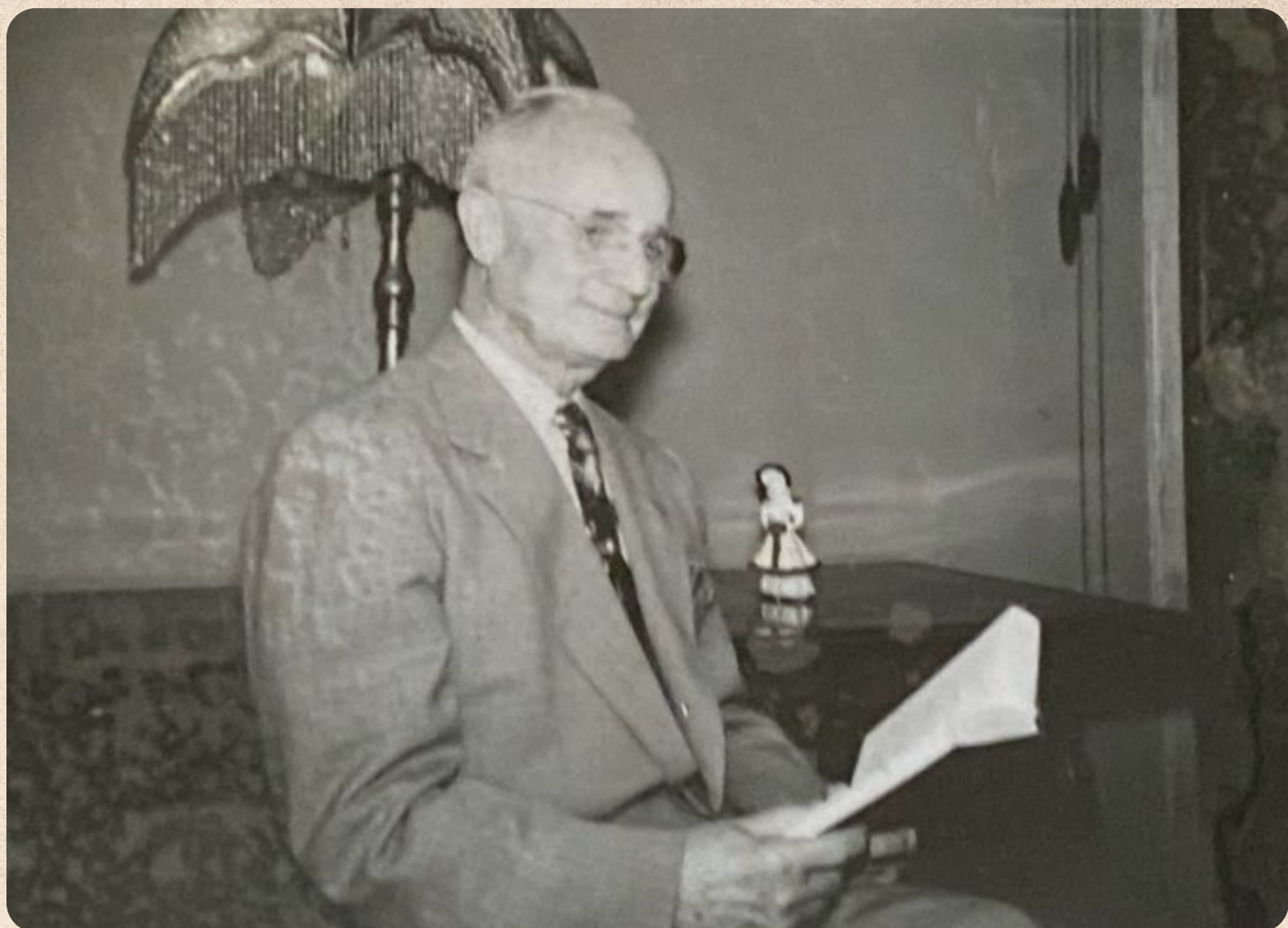
Napoleon Hill čte ve svém domově knihu.